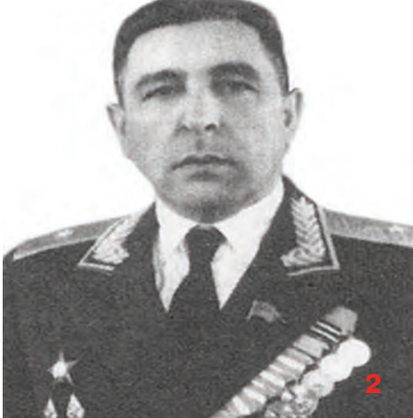
Mahmud Əbdülrza oğlu Əbilov (3)

1942-ci ilin payızında Bakı neftinə can atan hitlerçilər Şimali Qafqazın şəhər və kəndlərini müharibə alovlarına bürümüşdülər. Polkovnik Hacıbaba Zeynalov 416-cı diviziyanın qərargah rəisi idi. O burada özünü hərbi təcrübəyə, yüksək döyüş qabiliyyətinə, gözəl təkilatçılıq məharətinə malik sərkərdə kimi göstərdi. Zaqafqaziya Cəbhəsinin 396-cı