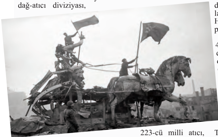
223-cü milli atıcı,

İkinci Dünya müharibəsinin başlanması ilə əlaqədar olaraq komandanlığın 1941-ci ilin 18 oktyabr tarixli əmrinə əsasən azərbaycanlılardan ibarət 77-ci dağ-atıcı diviziyası,